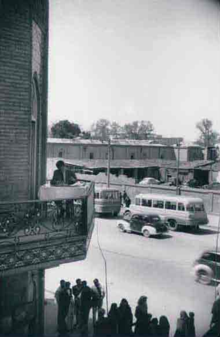
► Nicolas Bouvier, Téhéran, juin 1955