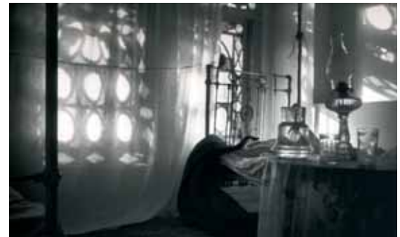
Nicolas Bouvier - Iran, 1954

Un grand merci aux libraires, auteurs et écrivains qui ont bien voulu nous accompagner dans cette démarche, et nous livrer leurs regards sur ces récits de voyage. Formulons enfin le vœu que cette première édition réponde à vos envies de découvertes littéraires et humaines.